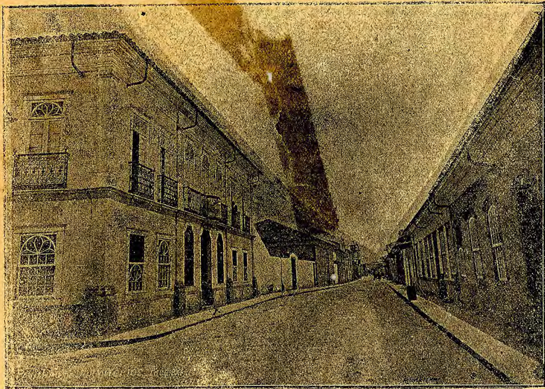
Rua Direita e suplemento do Gymnasio