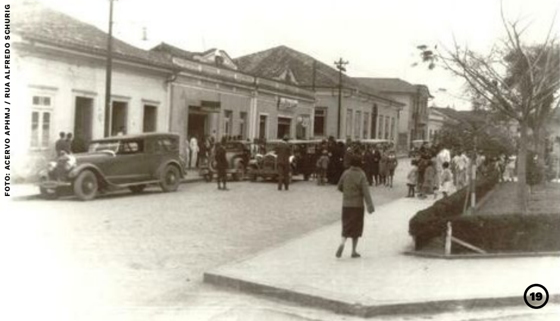
RUA ALFREDO SCHURIG