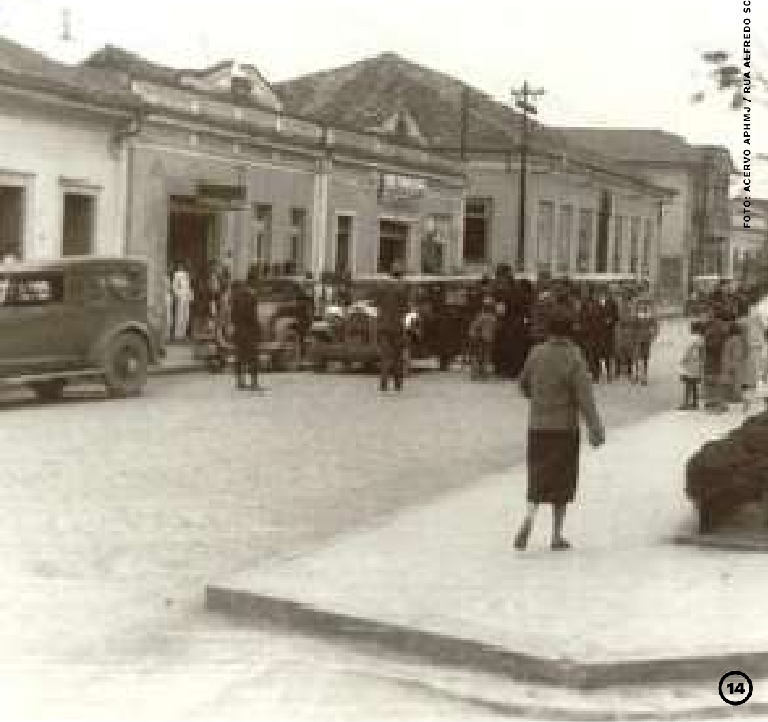
RUA ALFREDO SCHURIG